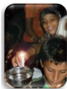
インド初のキャンドル

“Gleam Candle”は注水しなければ5年～10年以上も発電能力を失う事がないため、 災害時の備蓄用 としても最適です。